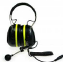
AK5850HS REF : AK5850HS