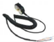
EMMAI-2H REF :1023533312