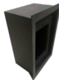
Caja empotrar TA-18 Nº artículo:008140180