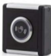
Sensor de llamada sin contacto Nº de artículo: 2390020100