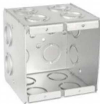
TA-2 Número de artículo: 1008140020