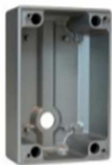
TA-1 Número de artículo: 1008140010