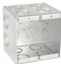
TA-2 Número de artículo: 1008140020