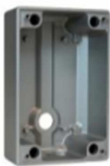
TA-1 Número de artículo: 1008140010