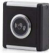
Sensor de llamada sin contacto Nº de artículo: 2390020100