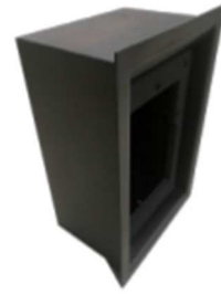
Caja empotrar TA-18 Nº artículo:008140180