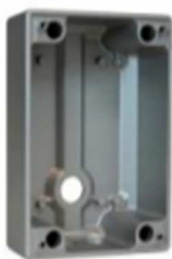
TA-1 Número de artículo: 1008140010