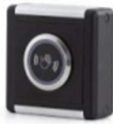
Sensor de llamada sin contacto Nº de artículo: 2390020100