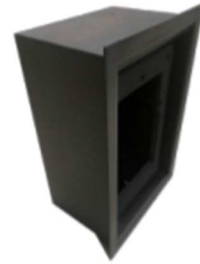
Caja empotrar TA-18 Nº artículo: 008140180