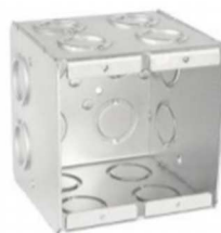
TA-2 Número de artículo: 1008140020