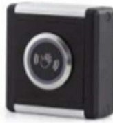
Sensor de llamada sin contacto Nº de artículo: 2390020100