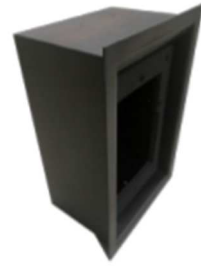
Caja empotrar TA-18 Nº artículo:008140180