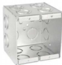
TA-2 Número de artículo: 1008140020