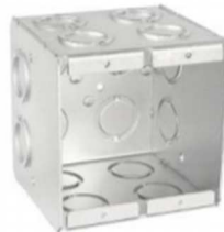
TA-2 Número de artículo: 1008140020