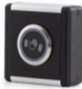
Sensor de llamada sin contacto Nº de artículo: 2390020100