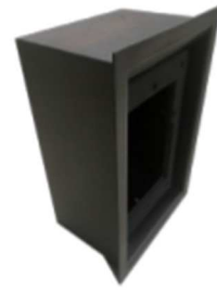
Caja empotrar TA-18 Nº artículo:008140180