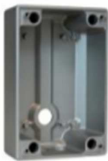
TA-1 Número de artículo: 1008140010